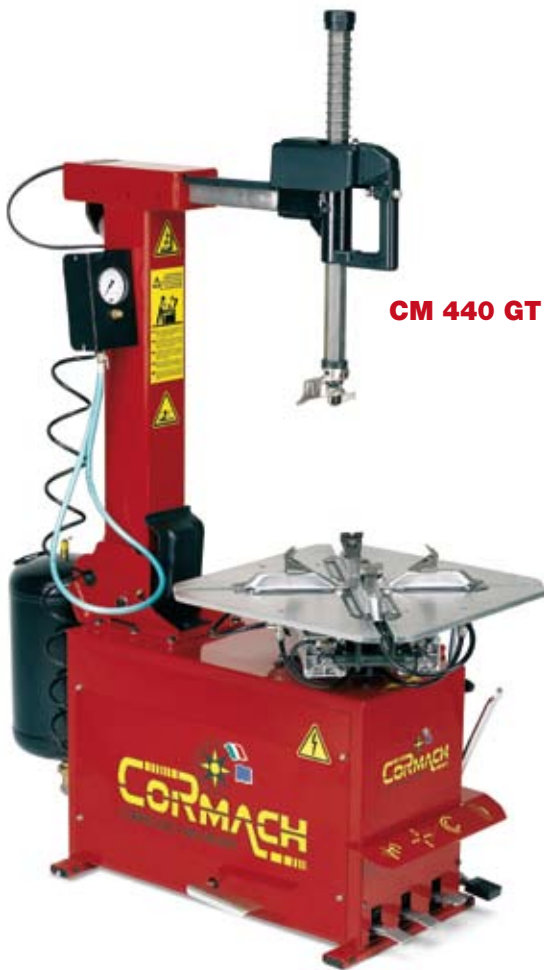
CM 440 GT