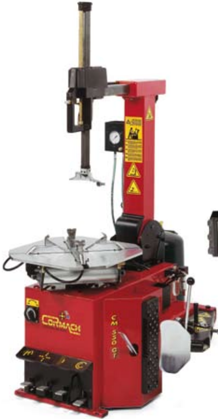
CM 550 GT

La versión DIGIT tiene el dispositivo electrónico para el inflaje de neumáticos tubeless.