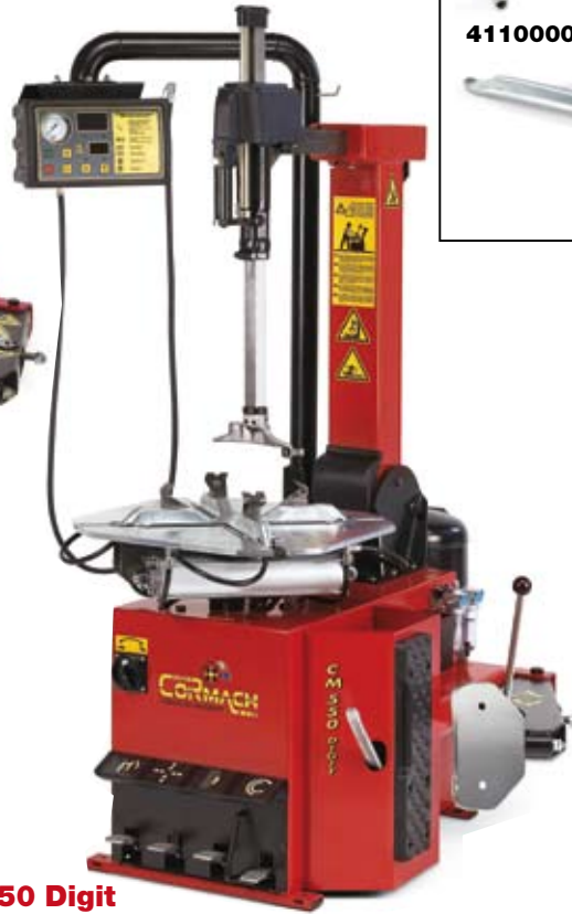
CM 550 Digit