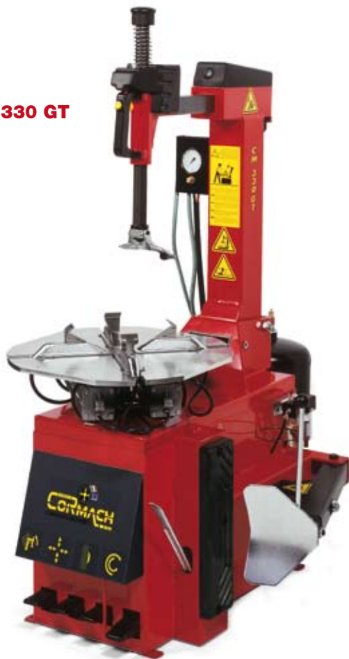
CM 330 GT

La versión GT tiene el dispositivo para el inflaje de neumáticos tubeless tramite un comando a pedal.